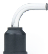
GUIDE DE LUMIÈRE